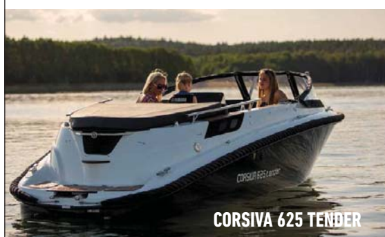
CORSIVA 625 TENDER