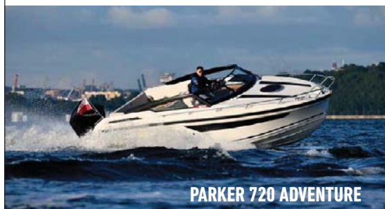
PARKER 720 ADVENTURE