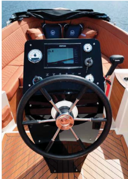
Přehledná konzole řízení s velkým kormidelním kolem je umístěna v zadní části kokpitu ve středu člunu.

Trup Corsivy 650 Tender byl navržen s důrazem na stabilitu, bezpečnost a dobré plavební vlastnosti ve vysokých i nízkých rychlostech. Podélný kýl se od příďe prohluhuje až k motorové šachtě na zádi. Příď i kýl chrání lišta z leštěného nerez, která bezpečně zabrání drobným poškozením laminátového trupu. Při nižších rychlostech, typicky v místech s regulovanou rychlostí plavby, dovoluje dlouhý kýl výbornou směrovou stabilitu. To není u menších lodí se závěsným motorem příliš obvyklé. Klasický tvar lodního