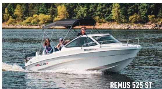
REMUS 525 ST